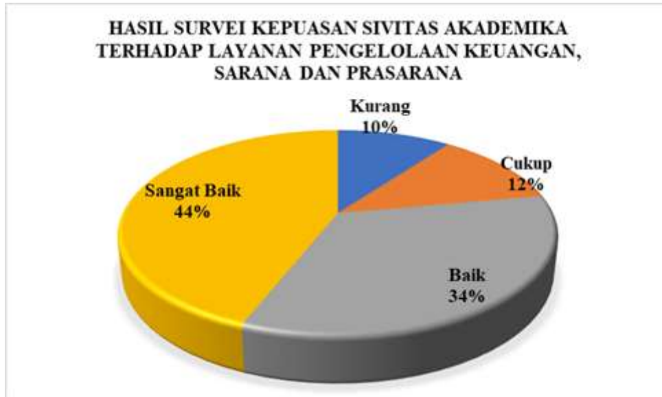
Diagram 4.1 Persentase Hasil Survei Kepuasan Sivitas Akademika Terhadap Layanan Pengelolaan Keuangan, Sarana dan Prasarana Prodi Manajemen

Berdasarkan hasil survei dapat dilihat pada Diagram 4.1 yang menggambarkan bahwa secara keseluruhan Sivitas Akademika program studi Manajemen memberikan nilai Sangat Baik sejumlah 44%, nilai Baik sejumlah 34%, nilai Cukup sejumlah 12%, nilai kurang 10%. Jika merujuk pada Tabel 2.3 nilai persentase tersebut berada pada rentang 41-60%, sehingga dapat disimpulkan bahwa kepuasan Sivitas Akademika Terhadap Layanan Pengelolaan Keuangan, Sarana dan Prasarana di program studi Manajemen masuk pada kategori CUKUP BAIK .