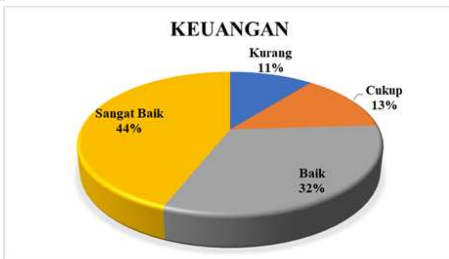
Diagram 3.1 Presentase Hasil Survei Kepuasan Sivitas Akademika terhadap Layanan Pengelolaan Keuangan, Sarana dan Prasarana Manajemen pada Aspek Keuangan

Berdasarkan Diagram 3.1 di atas dapat dilihat bahwa Sivitas Akademika yang memberikan nilai Sangat Baik 44% dan Baik sebanyak 32%. Nilai terbanyak terdapat pada poin 5: Kesempatan untuk melakukan pengembangan diri melalui kursus/ pelatihan/ Seminar/ Workshop di luar kampus. Sivitas Akademika yang memberikan penilaian Cukup hanya 13%, dan Sivitas Akademika yang memberikan nilai kurang sebanyak 11% pada aspek ini. Sehingga pada aspek Keuangan berada pada kategori Sangat Baik .